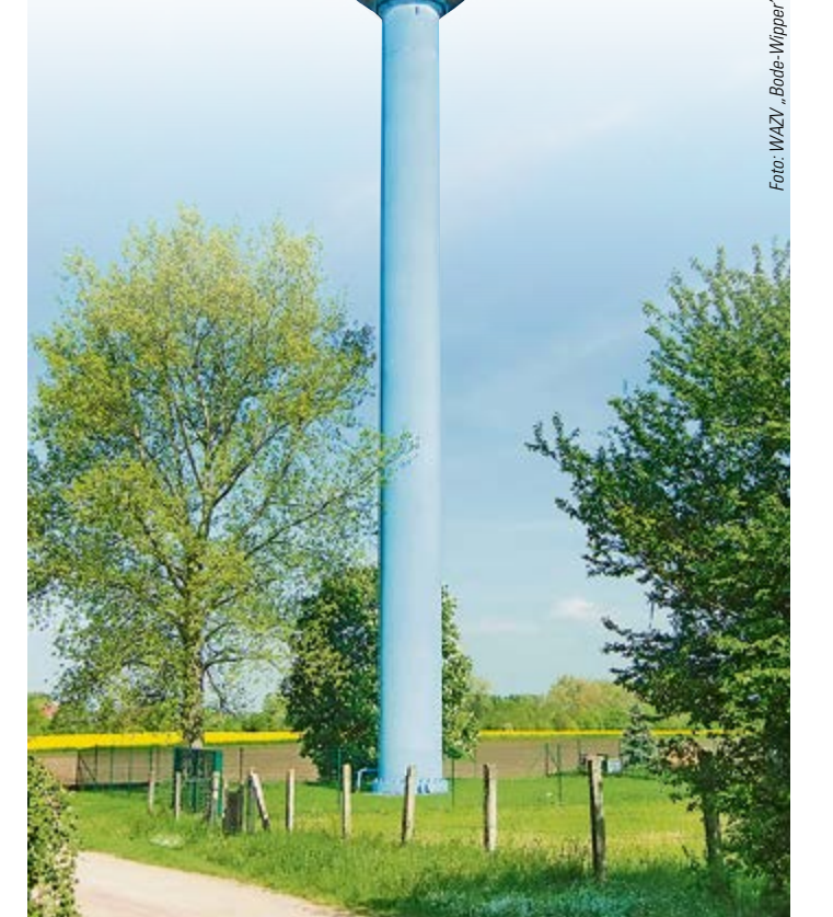
Kaum zu übersehen: der AquaGlobe in seiner vollen Pracht.

Wasser. Seit 1991 wird der 200m 3 Flüssigkeit fassende Wasserturm lediglich als Durchgangsbühler für das Trinkwasser genutzt, das in der Colbitzer Heide gefördert und an den WAZV „Bode-Wipper“ geliefert wird. Der 1974 gebaute AquaGlobe dient außerdem dazu, Druckschwankungen im Netz auszugleichen.