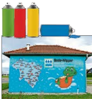
Der WAZV „Bode-Wipper“ in Staßfurt verbindet das Schöne mit dem Informativen und bildet auf einer Seite die Verbandskarte ab.

Wer sich berufen und in der Lage sieht, selbst solche Anlagen künstlerisch zu gestalten kann sich bei den Herausgebern dieser Zeitung melden. Auch Schüler aus dem Kunstunterricht sind gefragt.