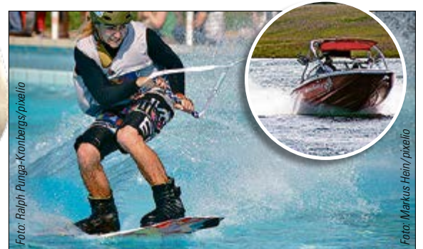
WAKEBOARDEN Ein Mix aus Wasserski und Wellenreiten. Geschwindigkeiten von knapp 40 km/h werden erreicht.