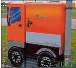
Auf dem Rasthof Süd an der A2 bei Magdeburg erfreut dieses thematisch passende Pumpwerk des AZV „Aller-Ohre“ Behnsdorf die Reisenden.