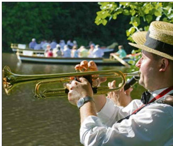
Kultur, Natur und Erholung vereinen sich im Sommer der Schloss- und Seekonzerte überall im Würmlitzer Park.