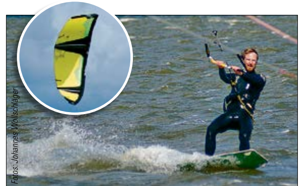
KITESURFING Auf der Suche nach der nächsten Böe – weltweit betreiben etwa 1/2 Millionen Menschen diesen Sport.