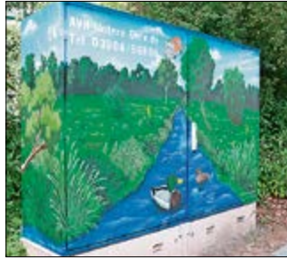
Gesehen in Haldensleben: Ein Pumpwerk, das sich seiner Umwelt anpasst und optisch beinahe mit dem Hintergrund verschmilzt.