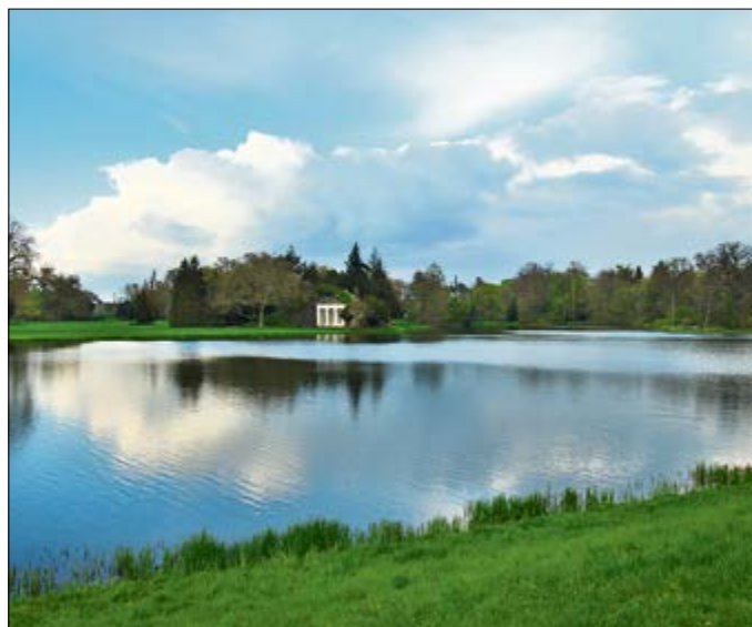
Die Grotte der Egeria ist der Nachbau eines Nymphäums, eines antiken Brunnenhauses, errichtet über einer Quelle.

Schloss- und Seekonzerte: Beinahe an jedem Wochenende dieses Sommers finden im Rahmen des „Gartenreichsommer 2017“ Konzerte von klassischer bis volkstümlicher Musik statt.