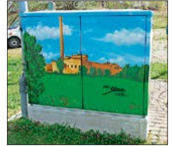
Regionale Industriegeschichte, auf Pumpwerk gebannt. Zu sehen ist die Allingerleber Zuckerfabrik im Gebiet des Behnsdorfer Abwasserverbandes.