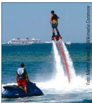
FLYBOARDEN Sprünge bis zu 9m – nicht mal Fliegen ist schöner.

Über das Wasser fliegen? Mit dem Flyboard kann man durch den Rückstoß eines Wasserstrahls, angetrieben durch einen Jetski, in die Luft steigen. Höhen bis zu neun Metern werden erreicht! Wegen des notwendigen Jetskis ist das aufsehenerregende Vergnügen nur auf zugelassenen Gewässern möglich, dessen Steuerung erfordert außerdem einen Sportbootführerschein. Sinnvoll ist es, die ganze Aktion zu buchen.