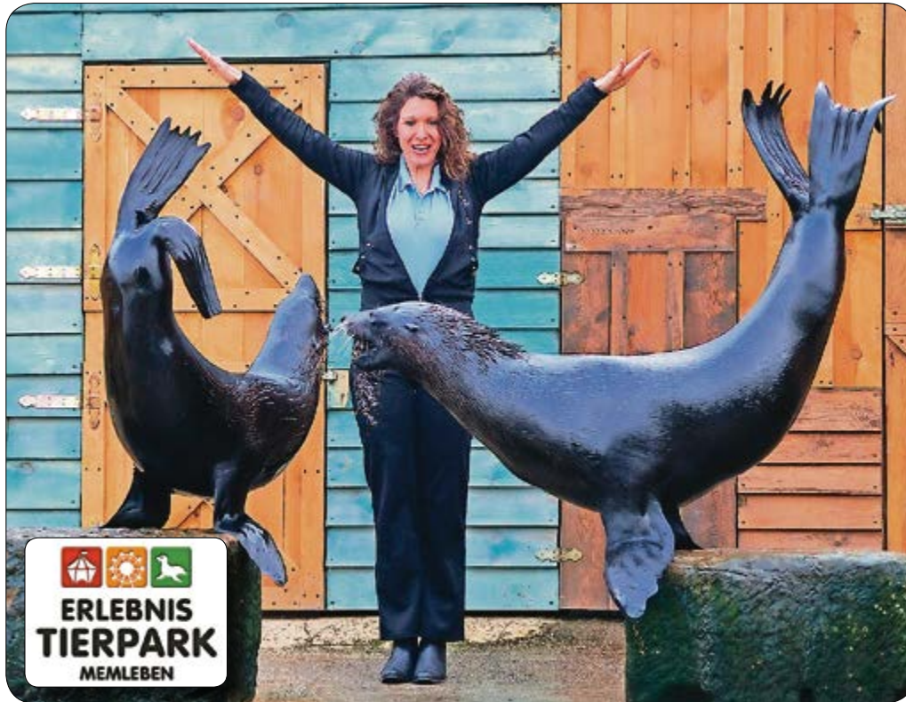
Die holländische Robbentrainerin bringt ihren Schützlingen ständig Neues bei. Die tägliche Fütterungsshow der lernfähigen Tiere ist einer der Höhepunkte im Programm des Erlebnistierparks.