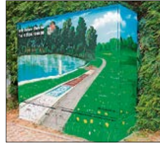
Diese Seenlandschaft findet man im Verbandsgebiet des AVH „Untere Ohre“ aus Haldensleben, im Norden unseres Bundeslandes.